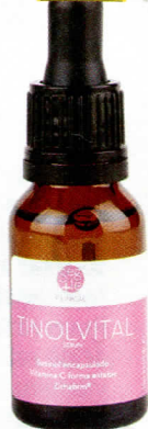
11. Sérum antimanchas Tinolvital (33 €), GPSLAB.

MEJOR SI... el suero contiene liposomas o nanosomas. "Unos efectivos vehículos que son capaces de transportar el producto a las capas más profundas de la piel", explica la experta.