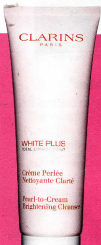
10. Limpiadora Crème Perlée Nettoyante Clarité (29,50 €), CLARINS (en El Corte Inglés).