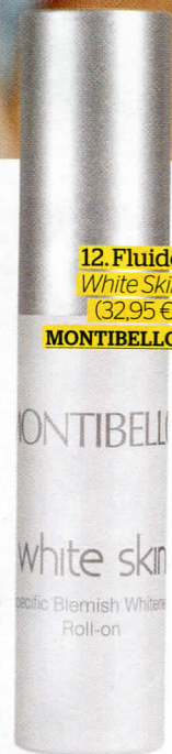
12. Fluido White Skin (32,95 €), MONTIBELLO.

TU ALIADO: una crema para el contorno de labios que evite el temido código de barras y aumente la elasticidad y la compactación cutánea. ¡No sumes problemas, resta!