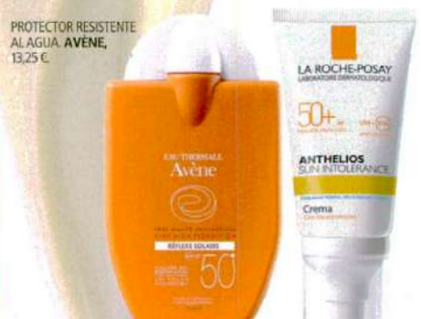
PROTECTOR RESISTENTE AL AGUA. AVÈNE, 13,25 €.

"Lo mejor es optar por filtros físicos, son más estables y no producen alergias", explica el doctor Plaza. Estos tienen una formulación para que no se absorban y funcionan como pantalla, mientras que los filtros químicos, se incorporan a la piel y captan la energía solar aunque la transforman para que sea inocua.