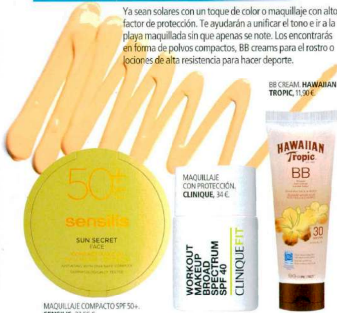
BB CREAM. HAWAIIAN TROPIC, 11,90 €

Ya sean solares con un toque de color o maquillaje con alto factor de protección. Te ayudarán a unificar el tono e ir a la playa maquillada sin que apenas se note. Los encontrarás en forma de polvos compactos, BB creams para el rostro o lociones de alta resistencia para hacer deporte.