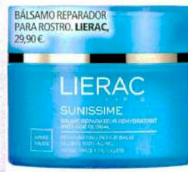
BÁLSAMO REPARADOR PARA ROSTRO. LIERAC, 29,90 €.