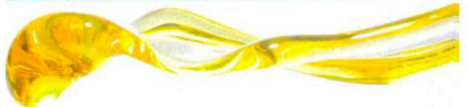
PROTECTOR TÉRMICO Y SOLAR. NUGGELA & SULÉ, 14,90 €