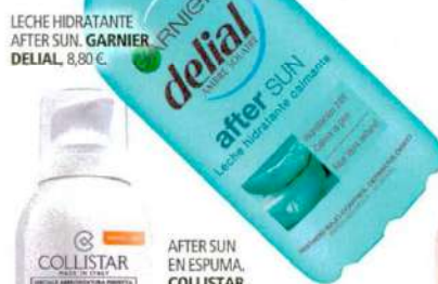
LECHE HIDRATANTE AFTER SUN. GARNIER DELIAL, 8,80 €.