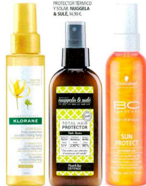
ACEITE PROTECTOR DE YLANG-YLANG. KLORANE, 14,70 €