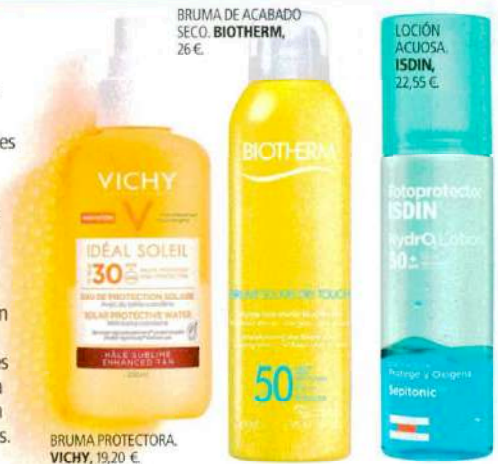
BRUMA DE ACABADO SECO. BIOTHERM, 26 €

En bruma, con base acuosa, ultraligeras... Existen texturas para todos los gustos. Son fáciles de aplicar, refrescan y no dejan sensación grasa. Sin embargo, no nos llevemos a engaño: también son aptas para pieles secas. Si es tu caso, apuesta por aquellas con activos nutritivos.