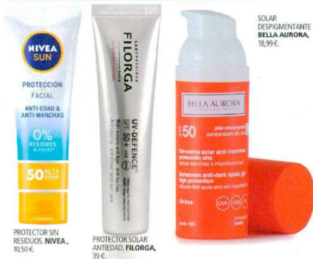
PROTECTOR SIN RESIDUOS. NIVEA, 10,50 €