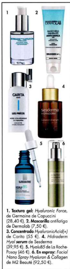
1. Textura gel: Hyaluronic Force, de Germaine de Capuccini (28,40 €). 2. Mascarilla antifatiga de Dermolab (7,50 €). 3. Concentrado HyaluronicAcid(+) de Carita (55 €). 4. Hidraderm Hyal serum de Sesderma (39,95 €). 5. HyaluB5 de La Roche-Posay (46 €). 6. En spray: Facial Nano Spray Hyaluron & Collagen de M2 Beauté (92,50 €).

rellenos, que, por eso, se encuentran en desuso”. Además, existen fórmulas de distintas densidades, el llamado “reticulado”. El Dr. Serra Mestre aclara: “Los hialurónicos no reticulados (menos densos) se usan para mesoterapia e hidratar la piel desde dentro y tienen menor duración. Los reticulados (más densos) se mantienen de 12 a 16 meses y permiten, con poco producto, llegar a esculpir un rostro y conseguir un buen efecto lifting ”, añade. “Con la ventaja de que son tratamientos cómodos, en los que se tarda poco, que se realizan en consulta y tras los que el paciente sigue su vida normal de inmediato, sin molestias. Las complicaciones pueden ser, quizá, un moradito o que se hinche un poquito”.