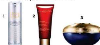
1. Lifting: Sérum Extraordinaire B21 cuello y escote, de Orlane (90 €). 2. Redensifica: Multi-Intensive Concentré Décollété et Cou , de Clarins (86,50 €). 3. Nutrición y firmeza: Orchidée Imperiale , de Guerlain (418,80 €).

● Lipoláser. Procedimiento ambulatorio para eliminar papadas moderadas o severas, eso sí, sin holgura cutánea. El láser diluye la grasa para su posterior extracción mediante cánulas (una liposucción al uso), al tiempo que coagula y asegura el pliegue uniforme de la piel. Dónde: Instituto Médico Láser ( iml.es ). Dolor: anestesia local y sedación. Precio: a partir de 2.300 €.