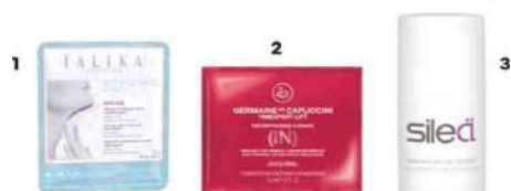
1. Alisa y reafirma: Bio Enzymes Mask cuello, de Talika (7,90 €). 2. Efecto tensor: Recontouring V-Shape , de Germaine de Capuccini (16 €). 3. Reparadora: Repair Cream FND , de Sileä (66 €).

Emplear productos específicos extranutritivos, reafirmantes y de efecto de relleno de las arrugas.