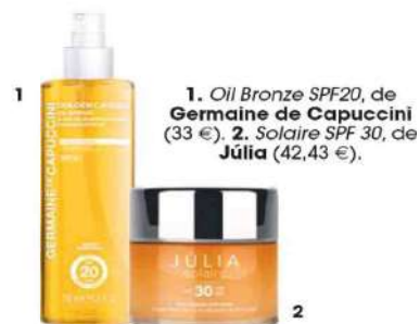
1. Oil Bronze SPF20, de Germaine de Capuccini (33 €). 2. Solaire SPF 30, de Júlia (42,43 €).