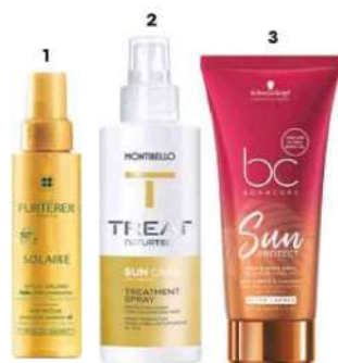
1. Aceite protector Solalabe, de René Furterer (18,50 €). 2. Tratamiento Sun Care, de Montibello (16 €). 3. Hair & Body Bath Sun Protect, de Schwarzkopf Professional (13,20 €).

TRATAMIENTO. Además de evitar los peinados con raya para no dañar el cuero cabelludo, intentar llevarlo recogido el mayor tiempo posible y huir de las herramientas térmicas, incluye en tu ritual de cuidado capilar diario tratamientos con agentes protectores que cuiden el cabello frente a las radiaciones solares, prevengan la deshidratación y protejan la fibra capilar.