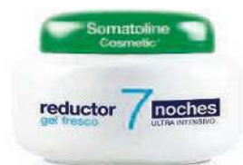
Slimtech Cell-Control de Jeanne Piaubert (49 €). Aceite Adelgazante Celulitis Infiltrada de Nuxe (26,90 €). Reductor 7 Noches Gel Fresco Ultra Intensivo de Somatoline (49,90 €).