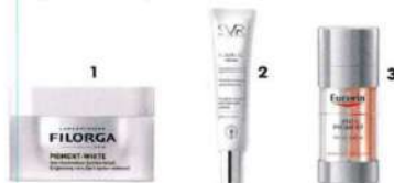
1. Pigment-White , de Filorga (62 €) 2. Clairol Sérum , de SVR (35 €). 3. Anti-Pigment Dual Serum , de Eucerin (39,90 €).

¿Su eliminación por completo? Casi imposible. Pero algunas sí se pueden atenuar o reducir.