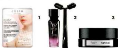
1. Mascarilla de biocelulosa, de Júlia (10,99 €). 2. Forever Youth Liberator Y-Shape Concentrate , de YSL (119,10 €). 3. Flawless Neck , de Sepal (155 €).

Cremas y serums específicos mantienen la hidratación natural con activos que aumentan la producción del propio ácido hialurónico y vascularizan la zona.