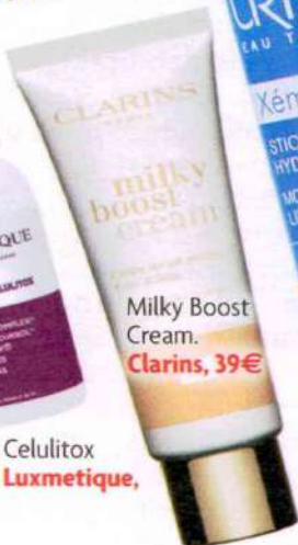
Milky Boost Cream. Clarins, 39€