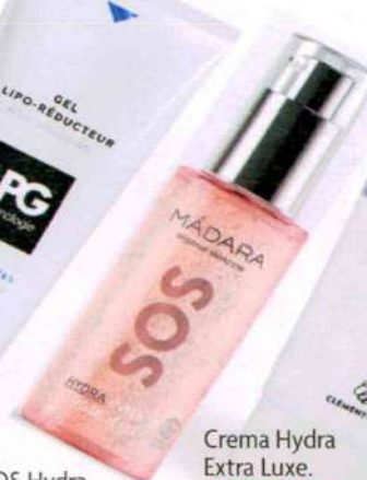
SOS Hydra Intense Rose Jelly. Mádara, 32,90€