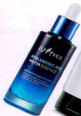
Hyaluronic Water Essence. Isntree, 37,95€

de relleno. Las moléculas de AH están reticuladas o entrelazadas entre sí con el fin de darles mayor solidez y durabilidad, protegiéndolas de los factores de degradación a los que se ven expuestas al infiltrarlas en nuestro organismo". Encanto a su aplicación estrella, los reticulados se emplean para rellenar arrugas y recuperar el volumen.