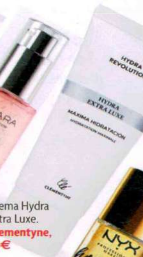
Crema Hydra Extra Luxe. Clementyne, 30€