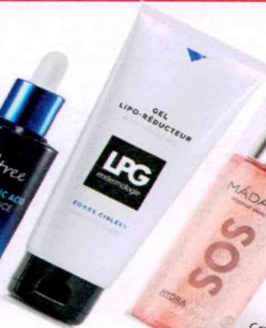
Gel Lipo-reductor. LPG, 29,99€