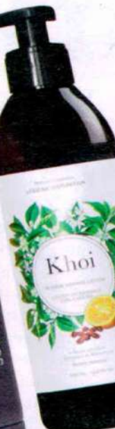
Loción Hidratante Khoi. Krim, 21,95€