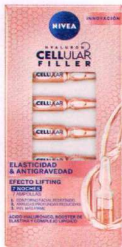
Hyaluron Cellular Filler. Nivea, 13,99€