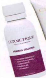
Fórmula Celulitox bebible. Luxmetique, 33,50€