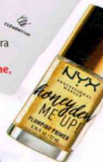
Sérum Honey Dew Me Up. NYX, 16,95€